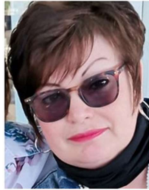
Zandrivan Tonder 24 Mei